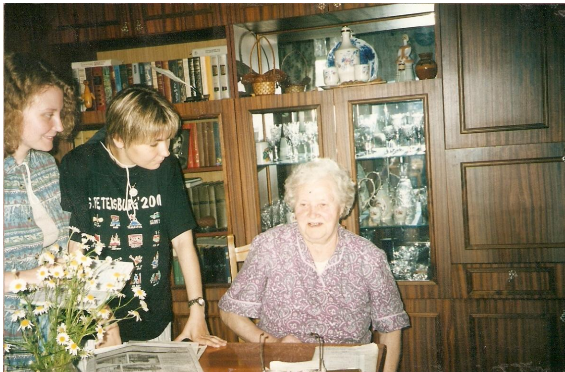
Рис. 2. Диалектологическая экспедиция в Торопецкий район в 2002 г.