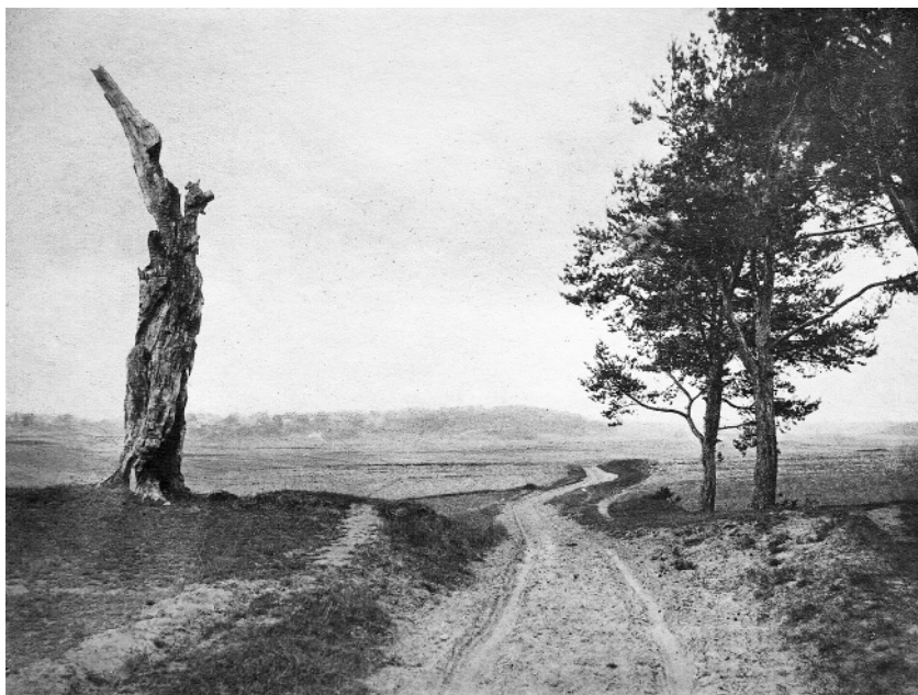
Остатки третьей пушкинской сосны. Фото А. К. Красуского, между 1895 и 1899 (ВМП)

Крупных частей сосны было несколько, но все они, за исключением одной, погибли. Вероятно, причина их гибели состоит в том, что на непросвещенный взгляд они ничего из себя не представляли игодились только на топку печи.