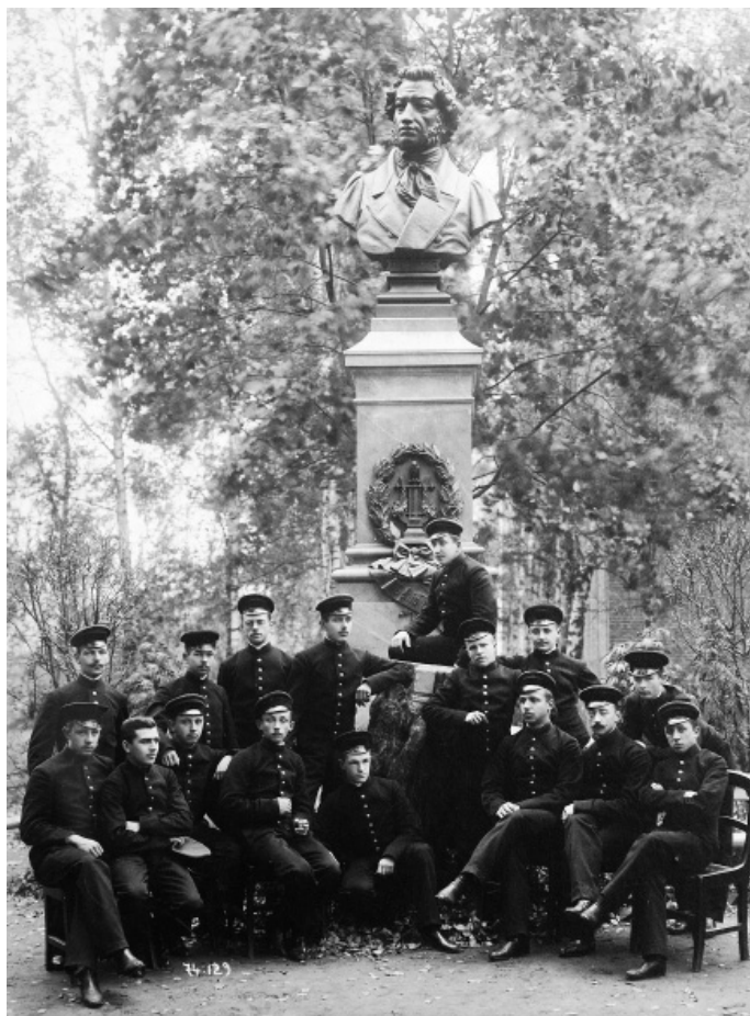
Лицейсты у памятника А. С. Пушкину в саду Царскосельского лицея, 1900-е гг. (ВМП)