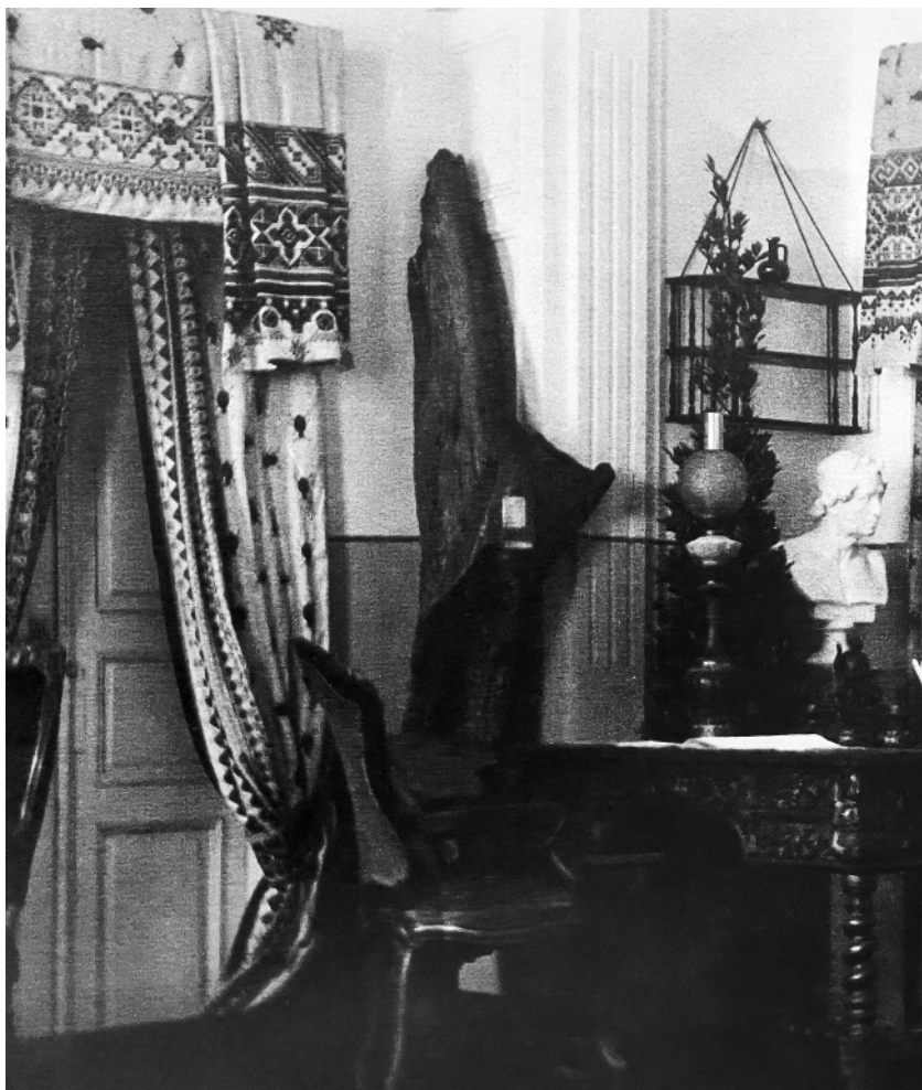
Фрагмент юбилейной пушкинской выставки в усадьбе Маркутье, 1937 (Литературный музей А. С. Пушкина «Маркучяй», Вильнюс)