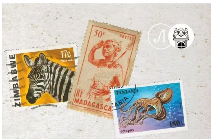
Лекция “История стран Восточной Африки в почтовых марках. Ч.3”