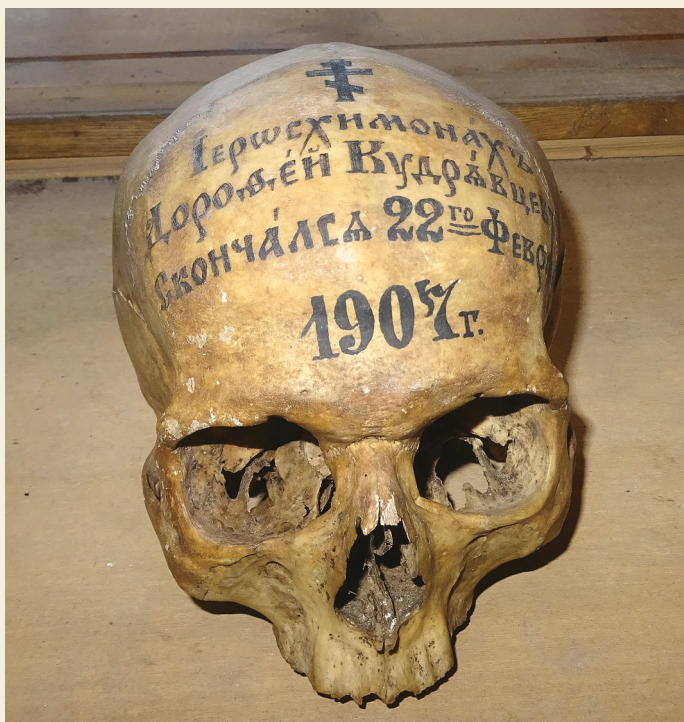
Честная глава о. Дороева (Кудрявцева). Современная фотография. Публикуется впервые