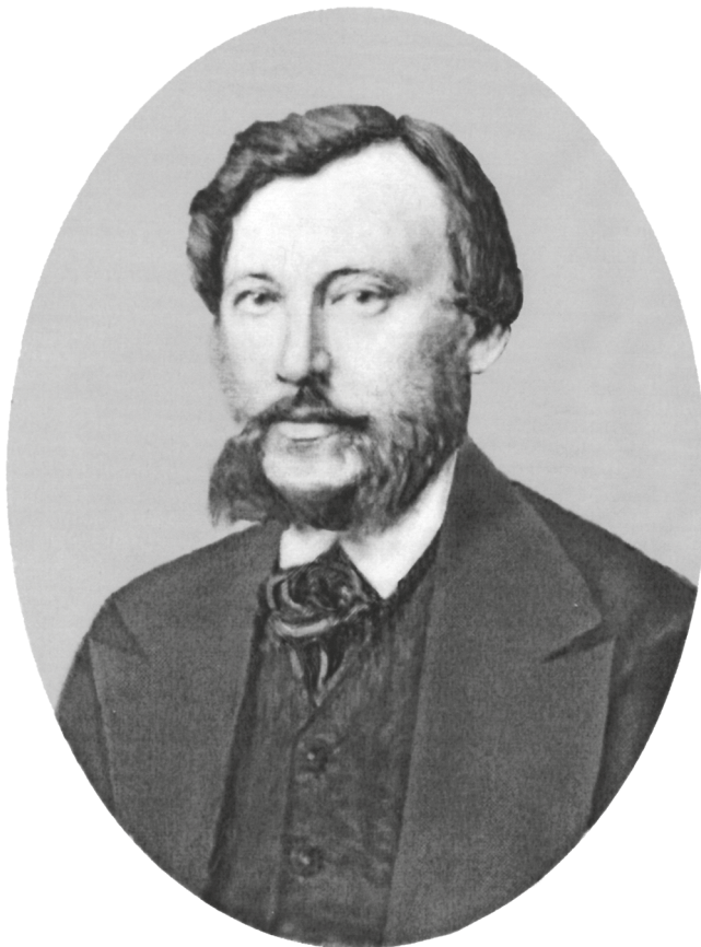
К. Н. Леонтьев. Фотография 1867 г.