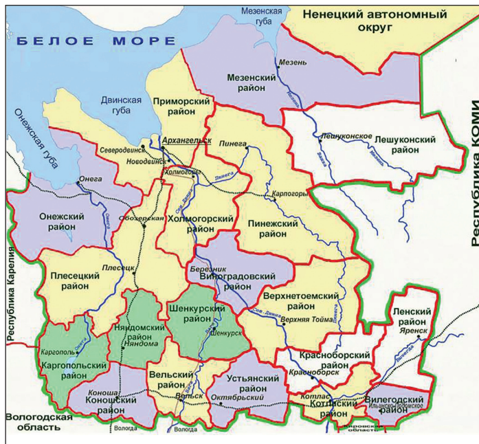
Рис. 1. Административная карта районов Архангельской области