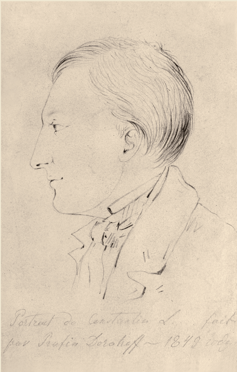
Р. И. Дорохов. Портрет К. Леонтьева. Москва (?), 1849. Бумага, графитный карандаш. ГИМ. Публикуется впервые