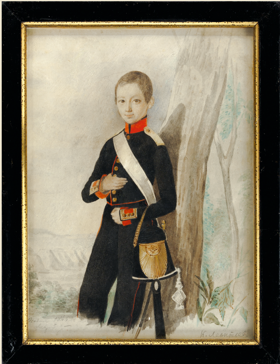
К. С. Соколин. Портрет К. Леонтьева в форме кадета Дворянского полка. Петербург, 1844. Бумага, акварель. ГИМ. Публикуется впервые