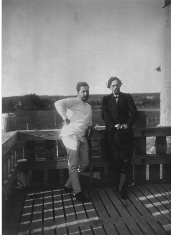
Л.Н. Андреев и А.А. Измайлов

Темы, поднимаемые в эпистолярном диалоге двух современников: специфика работы в разных изданиях, редакционные портфели и планы публи-