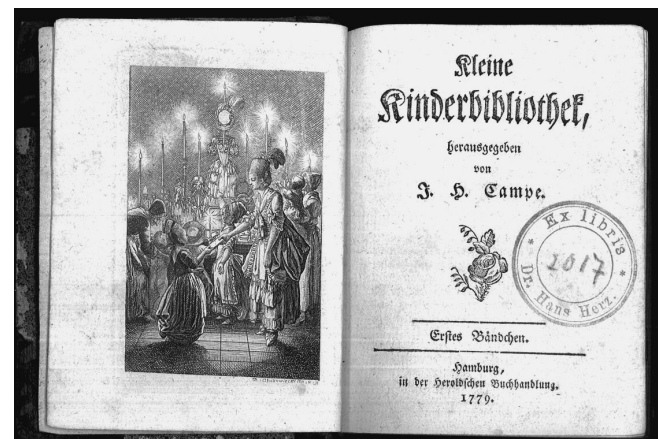
Титульный лист одного из первых изданий «Маленькой детской библиотеки» И.-Г. Кампе (Гамбург, 1779 год)

Бедняжка вопит со слезами, Ни сесть ни лечь ей не дает, Как будто острыми иглами Ее кто колет, так ревет.