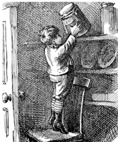
«Плохой мальчик»: Иллюстрация к «Рассказу о дурном мальчике» Марка Твена (1875)

повести «Нетерпеливый», которого хозяин убеждает не чесаться, но Степан, подобно Рудольфу, упрям, и так же бесславно гибнет от болезни, которую «с пользой можно было бы перенести». Мальчик Андрей из повести «Безделица» («Золотое зеркало», 1787), не слушающий отца, который велит ему лежать в постели при простуде, умирает, получив осложнения от болезни. Точно такая же история происходит с мужиком Григорием в повести «Малость» («Детской друг...», 1797), которого предостерегает хозяин, из чего выводится о мораль о необходимости послушания хозяину и пр.