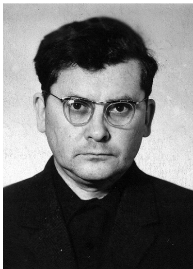
Борис Николаевич Путилов (1919–1997)