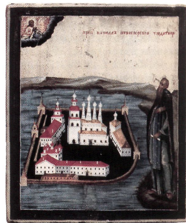
Прп. Кирилл Новоезерский, с видом мон-ря. Икона. Кон. XVIII в. (ВГИАХМЗ)

четв. XVII в. сказано: «Образ аки Николая, брада поострее, надсед, в схиме, мантия коротка, ряска празелень, бос, в руках свиток, а в нем писано: «Божественным духом подвизаем»» (ИРЛИ (ПД). Бобк. № 4. Л. 74 об.; аналогичное описание с добавлением: «...брада менши Александра Ошевенского» — в ркп. 3-й четв. XVIII в., РНБ. О.ХIII.1. Л. 56). В подлинниках кон. XVIII — 40-х гг. XIX в.: «...надсед, брада менши Василия Кесарийского, на плечах схима, в мантии малой, ряска празелень, бос, в руках свиток...» (РНБ. Погод. № 1931. Л. 106; см.