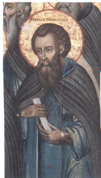
Прп. Кирилл Новоезерский. Фрагмент иконы «Собор Белозерских чудотворцев». Посл. четв. XVIII в. (ц. Богоявления в Белозерске)

На смертном одре в окружении учеников К. оставил пророчество о грядущих бедствиях, уготованных «земле нашей». После престав-