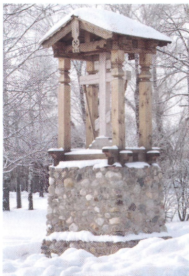
Памятный крест на родине прп. Кирилла Новоезерского в Галиче. Фотография. 2012 г.

Биография. Святой происходил из рода патриарших детей боярских Белых. В 15 лет, тайно уйдя из дома, он принял постриг в Корнилиевом Комельском в честь Введения во храм Пресв. Богородицы мон-ре . В монашеском постриге святой получил имя, возможно, в честь свт. Кирилла Александрийского: образ этого святителя находился среди икон в часовне во имя К. тогда, когда еще не была написана икона преподобного (Опись 1581 г. // Арх. СПб ИИ РАН. Кол. 115. Д. 663. Л. 7 об. — 8).