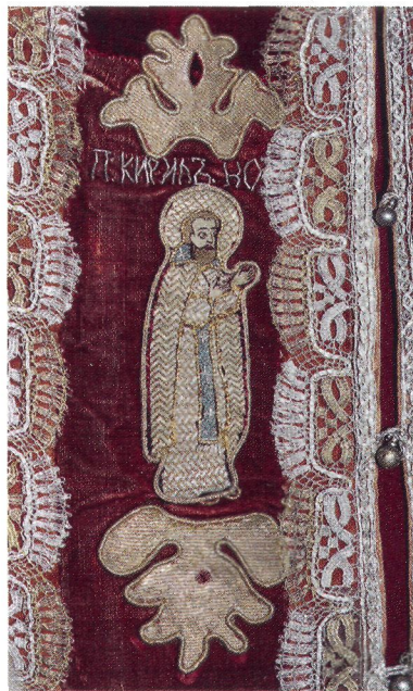
Прп. Кирилл Новоезерский. Фрагмент епитрахили. Кон. XVII (?), XIX в. (КБМЗ)

Мощи К. были вскрыты в янв. 1919 г. и оставлены в храме. Согласно воспоминаниям С. М. Голицына, побывавшего на Красном о-ве в 1928 г., там жили 5 монахов, молившихся келейно. В 1929 г. мон-рь закрыли, в его постройках организовали лагерь для заключенных. Голицын не упоминает о мощах К., сейчас их местонахождение неизвестно. В наст. время в бывш. Новоезерском мон-ре находится колония для отбывающих пожизненное заключение, здесь имеется моленная комната, где совершаются молебны святому. Посвященная К. часовня действует в Белозерске. Престолы во имя К. освящены в ц. во имя блгв.