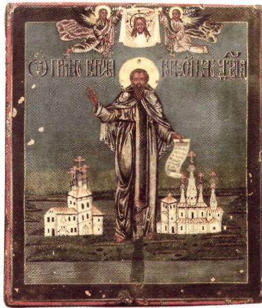
Прп. Кирилл Новоезерский, с видом мон-ря. Икона. Кон. XVIII в. (ВГИАХМЗ)

поместил молитвы Господу Иисусу Христу и Пресв. Богородице, составленные, по его утверждению, К. (в Житии К. этих молитв нет), затем молитву, обращенную к К., но она в сборнике прерывается вместе с окончанием листа. Указанные молитвословия известны в единственном списке. Напротив, созданная вместе с Лицевым сборником молитва: «О Божественная, пречестная и священная главо и благодати Святаго Духа исполненная, преподобне отче...» известна во множестве списков. В сборниках, посвященных К., эта молитва, вероятно, заме-