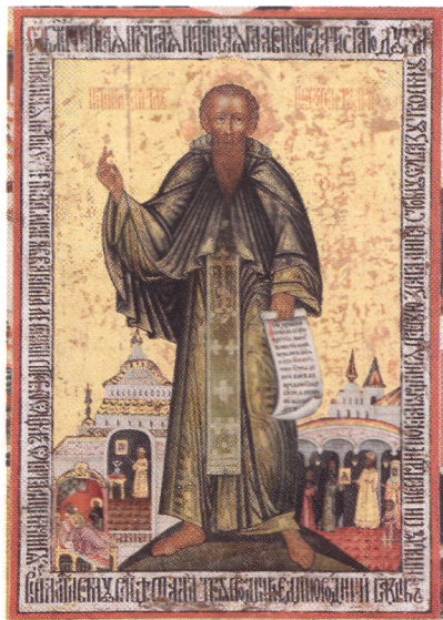
Прп. Кирилл Новоезерский. Средник житийной иконы. Кон. XVII — 1-я четв. XVIII в. (КБМЗ)

Основная редакция была создана в 1623–1625 гг. Житие К. подверглось стилистической правке, были добавлены 20-е чудо и предисловие (на основе предисловия к Житию прп. Евфимия Великого). Основная редакция стала источником всех последующих переработок Жития К., вошла в крупные минейные своды (Тулуповский, Милютинский, Сийский, братьев Денисовых ), к ней дописывались чудеса святого. До кон. XVIII в. этот текст по крайней мере 3 раза редактировался, приспособлялся к новым языковым и стилистическим нормам, отражал изменения в почитании святого. Выделяют 4 варианта Основной редакции, созданные в Новоезерском мон-ре: ран-