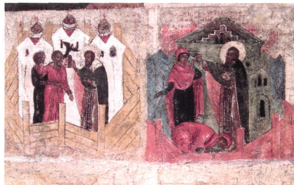
Исцеления прп. Кирилла Новоезерского. Клейма иконы «Прп. Кирилл Новоезерский, в житии». Сер. XVII в. (ЧерМО)

В чуде, датированном дек. 1627 г., рассказывается: когда во время служения молебна у мощей преподобного подняли помост, чтобы, согласно установившейся практике, взять «персть», от мощей изшел «благонный дым», видимый всеми собравшимися; одновременно совершились исцеления, о к-рых сообщили в Москву. Царь и патриарх поручили освидетельствовать чудо Ростовскому митр. Варлааму, а тот в свою очередь — настоятелю Ки-