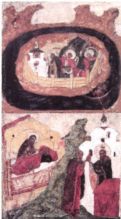
Чудеса прп. Кирилла Новоезерского. Клейма иконы «Прп. Кирилл Новоезерский, в житии». Сер. XVII в. (ЧерМО)

В 1581 г. над мощами святого уже стояла деревянная часовня, у раки преподобного собирались пожертвования. В описи Новоезерского монастыря 1581 г. иконы К. не упоминаются. В описи 1614 г. зафиксированы 2 иконы преподобного: местный образ в Воскресенской ц. и икона-пядница в часовне. В 1612 г., когда обитель испытывала материальные трудности, средства собирали у населения ближайшей округи с некой иконой, возможно с образом К.: «Да Ондрей старец с образом собрал о чудотворцеве памяти» (Арх. СПб ИИ РАН. Кол. 115. Д. 662. Л. 19, 27, 79). В 1626 г. по монастырскому заказу были написаны 4 иконы К., по-видимому «раздаточные» (Там же. Л. 174 об.). Согласно описи 1628 г., на раке святого находилась его икона — вклад кн. И. М. Катырева-Ростовского (ГИМ. Увар. № 1116. Л. 14 об.).