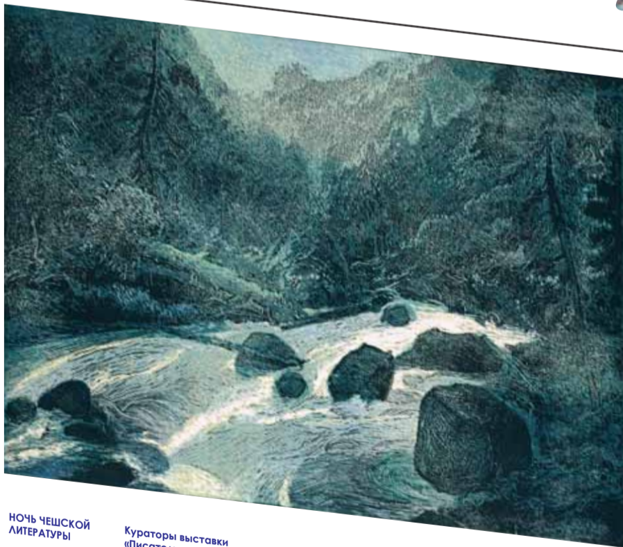
НОЧЬ ЧЕШСКОЙ ЛИТЕРАТУРЫ