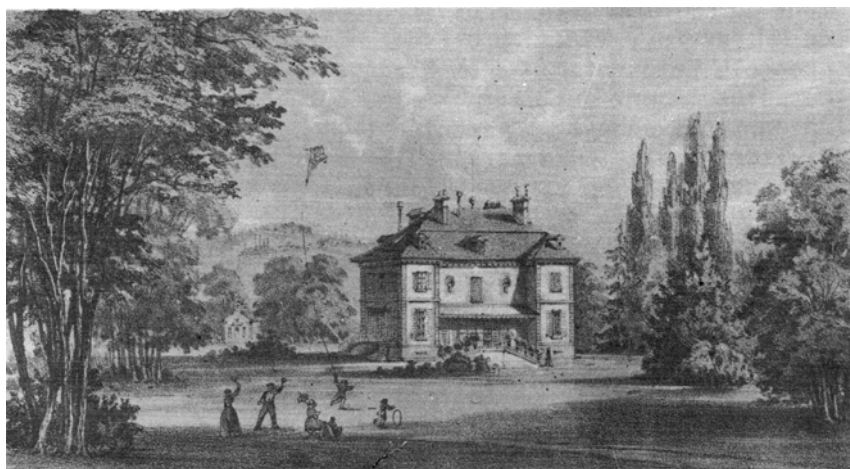
Замок Бельфонтен. Литография, опубликованная Денекуром ок. 1850 г.

остановиться на некоторых основных чертах их нового существования, поскольку знакомство Тургенева с семьей Трубецких относится, в сущности, к этому периоду.