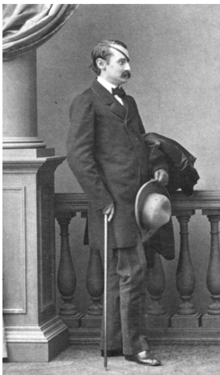
Князь Н. А. Орлов. Фотография. 1860-е гг.

ственника, Л. Н. Толстого, а также, возможно, и самого Тургенева: есть основания полагать, что оба мужчины серьезно намеревались ухаживать за ней. 25 На улице Клиши Орлова влекла также возможность встре-