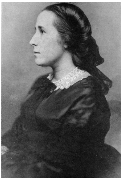
Княгиня Е. Н. Орлова

чатся и беседовать с выдающимися русскими современниками, а также с влиятельными французами и гостями из других стран. По всей видимости, у Трубецких часто устраивались чтения вслух различных пьес. Так, на одном из них читалась комедия А. Н. Островского «Доходное место», которую Тургенев предложил по рекомендации Анненкова, но сам впоследствии активно раскритиковал. 26 Судя по всему, 16 марта 1857 года Толстой и Тургенев вместе присутствовали в доме у Трубецких на спиритическом сеансе медиума Даниеля Дангласа Юма (Хьюма). Пять дней спустя в письме к Анненкову Тургенев сообщал: «Был я в одном доме, где известный колдун Юм <...> должен был произвести свои чудеса; но ничего не вышло; только раз по моему требованию что-то у меня три раза простучало под подошвой правой ноги. Хорошенько я не понимаю, как это было сделано. Но Париж только и толкует что о нем; в течение одной недели он три раза был в Тюльерийском дворце — и там, говорят, происходили удивительные вещи: и стол поднимался на воздух, и какие-то руки виднелись, и гармоники играли сами, и колоколь-