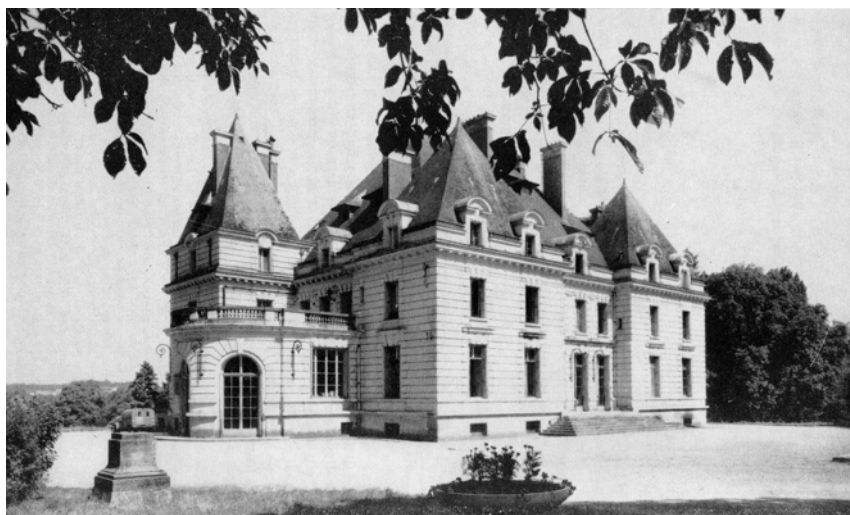
Замок Бельфонтен. Современная фотография

странство, как раз достаточное для непочтительных туристов, чтобы присесть и сделать свои дела. 11