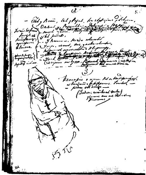
3. Ф. М. Достоевский. Подготовительные материалы к роману «Идуток». 1872—1874. Автограф