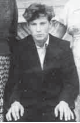
А.И. Малыгин. Фрагмент групповой фотографии. 1960 г.