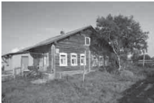
Дом в Койде, где останавливался Юрий Казаков. Фото 2014 г.

почту», – и далее повествуется про женщину-почтальона на Летнем берегу Белого моря, про то, как он хотел написать о ней «грустный, но героический рассказ», и что сейчас «как бы вновь встретился с давней своей героиней...».