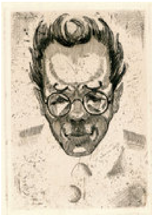
С. Залшупин. Портрет Алексея Ремизова. Офорт. Из альбома «Сергей Залшупин. Портреты». Берлин, изд-во «Гамаюн». Экземпляр № 91 (из 100 экземпляров). Коллекция Российского Фонда Культуры. Москва

Встречи Ремизова с художником продолжились в Париже. В архиве писателя сохранилось открытое письмо от 20 декабря от 1924 г., в котором Залшупин, подписавшись псевдонимом Сергей Шубин , выражал надежду на свой скорый визит (Amherst College Center for Russian Culture (USA). Alexei Remizov and Serafima Remizova-Dovgello Papers Series 1. B. 2. F. 7). Не исключено, что тогда же был создан еще один портрет Ремизова, который был представлен на персональной выставке художника, открытой в начале марта 1924 г. в парижской Галерее Биллье, в ряду портретов Вл. Соловьева, А. Блока, Андрея Белого, И. Шмелева, Б. Зайцева и М. Горького.