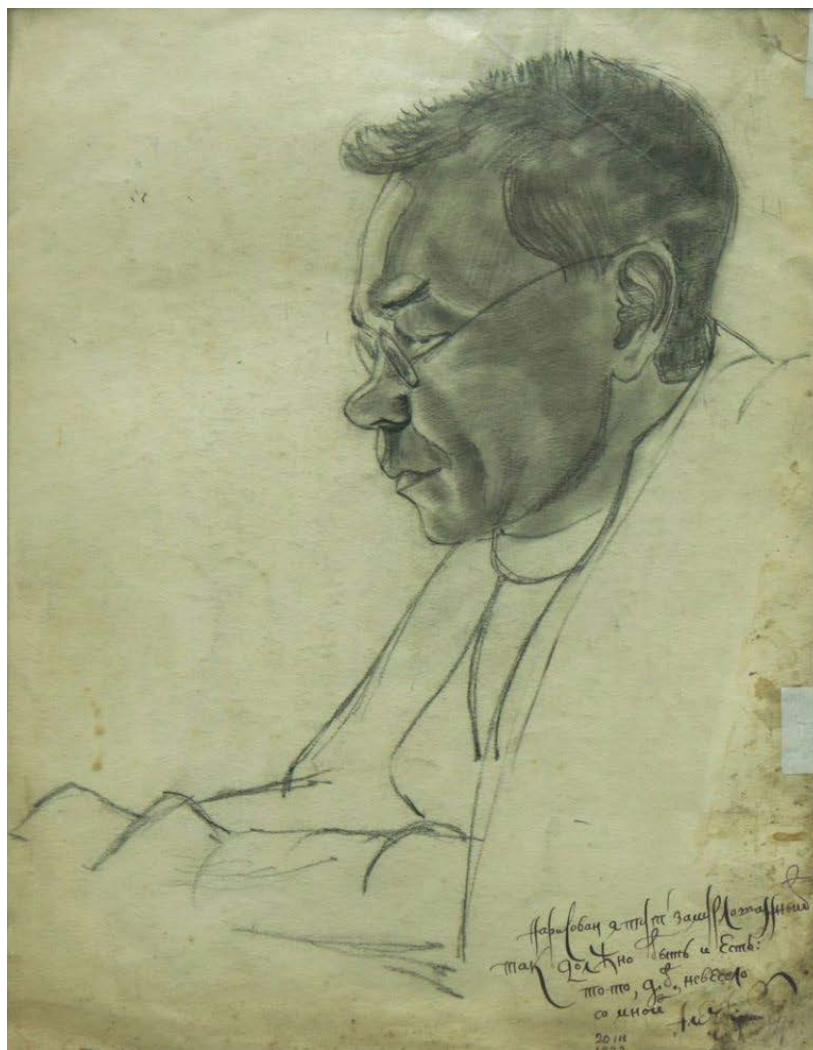
Сергей Залшупин (Серж Шубин). Портрет А. М. Ремизова. 1922, с надписью Ремизова. © René Guerra

Известна публикация фотографии с оригинала этого портрета (коллекция Р. Герра) с ремизовским инскриптом, характеризующий получившийся художественный образ: «Нарисован я тут замурлотанный <sic!> / так должно быть и есть: то-то, д<олжно> б<ыть>, невесело со мной. Алексей Ремизов. 20 III 1922» (воспроизведен в изданиях: Русский альманах. Париж, 1981, вклейка; а также: «Русский миръ»: альманах. СПб. 2014. № 9. С. 79).